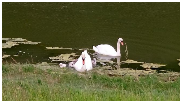
Takto vyvedly mladé v roce 2017. Foto ze 4. června.

V případě zájmu o využití nabízené pomoci je možné volat na číslo 732 842 664 nebo zaslat e-mail: bkb.brno@bkb.cz .