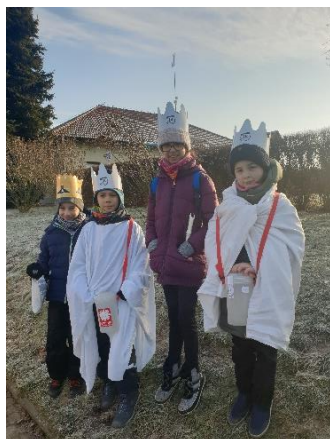
Foto z činnosti skautů