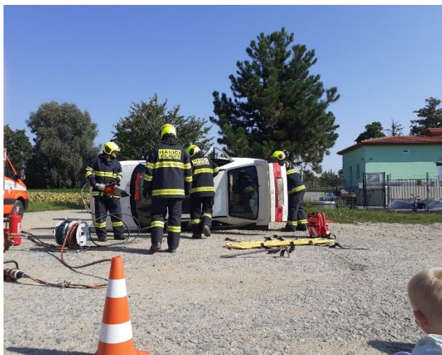
Ukázka vyprošťování řidiče z havarovaného auta.

Dětský den se letos uskutečnil v poněkud netradičním termínu, 4. září. Poděkování patří dobrovolným hasičům z Holasic, kteří připravili zajímavý program nejen pro děti, ale i pro dospělé. Viděli jsme ukázkou vyproštění řidiče po dopravní nehodě a hašení hořícího automobilu.