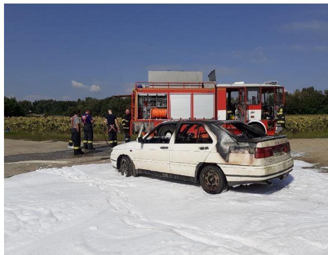
Auto po požáru. Bílá hmota je hasící pěna.